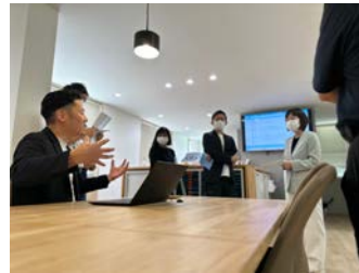
▲ディスカッションの様子