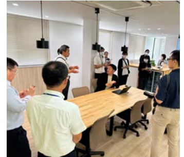
▲企業見学会の様子