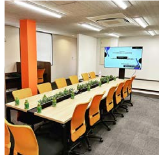
▲デジタル化による事務所の様子